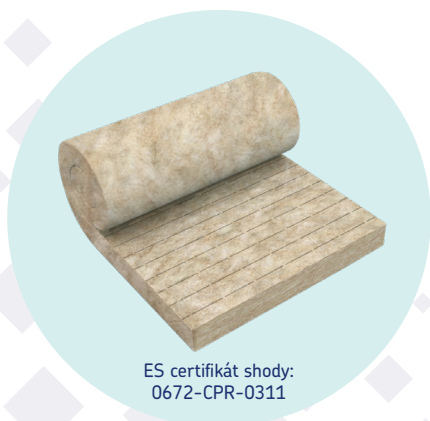
ES certifikát shody: 0672-CPR-0311